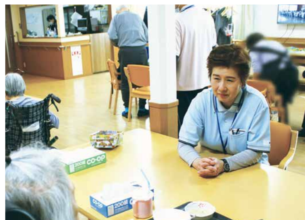
かんたき住之江ダイニングの様子

一般的に食道がんの手術は高侵襲を伴いますが、Oさんは初回診断時幸いにして遠隔転移がなかった事と、ご本人の体力があられた事、そしてなによりも根治目的であったため手術を選択されました。しかし術後の経過は順調にはいかず、様々な合併症を引き起こし退院がどんどん遠ざかっていきました。ご家族が面会に行かれるといつも「早く帰りたい」と訴えられ、ご本人はもろろんの事、ご家族もつらく苦しい日々でした。この状態では益々回復が遅れていく。娘さんは「せつかく食べられるようになる為に大変な手術を頑張ったんだから、自宅で母が作った料理なら食べられるはず」と、お父様の自宅での回復力にかけて退院を決められました。なんとしても、もう一度元気になってあげたいとい