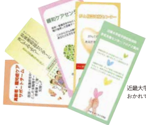
近畿大学病院外来ロビーに おかれている相談支援のパンフレット