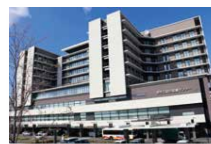
地方独立行政法人 堺市立病院機構 堺市立総合医療センター 堺市西区家原寺町1丁目1番1号 487床（一般病棟450床、救命救急センター30床、感染症病床7床） 日本医療機能評価機構認定病院 大阪府指定三次救急医療機関 大阪府災害拠点病院 地域がん診療連携拠点病院 臨床研修指定病院 地域医療支援病院