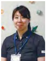
かんたき八尾北本町 ケアマネジャー